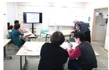
ある日の活動風景