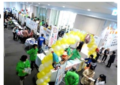
昨年の会場の様子