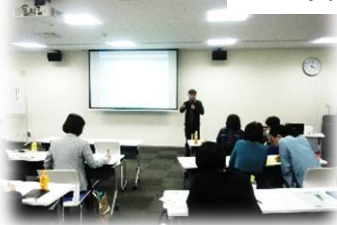
活動資金の集め方

各講座とも参加者から活発な質問や意見が出されました。参加者の皆さま、ご協力いただいた関係機関の皆さま、ありがとうございました。