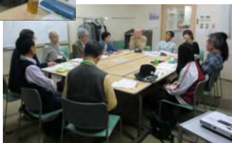
運営委員応募者説明会