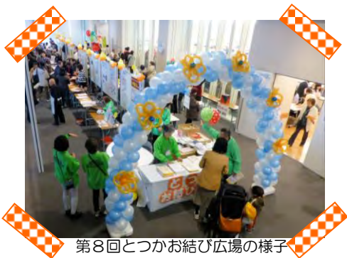
第8回とつかお結び広場の様子