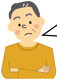
現役を引退した Fさんの場合

なにか始めてみたいけど・・・ 現役時代は仕事ばかりで趣味もないしなあ。近所に友人もいないし、地域の事もよくわからないし・・・