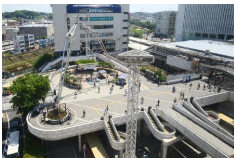
戸塚駅 ペDESTリアンデッキ(戸塚駅東口側全景)

http://www.city.yokohama.lg.jp/totsuka/chishin/music-town/streetlive/