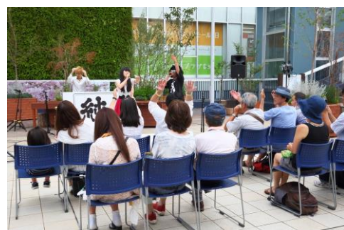
とつかストリートライブ(戸塚駅西口ペDESTリアンデッキ広場)