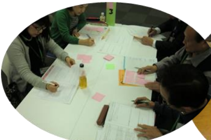
ワークではたくさんの気づきがありました