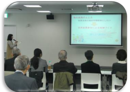
地域で実現させたい「夢プラン」の発表会