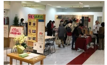
手づくり品の販売は大盛況

品濃町のビルの2階で平日オープンしている「東戸塚みんなの居場所 お茶の間♥楽交」が、4月中旬から西武東戸塚店に出張しています。「お茶の間♥楽交」の方からお話をうかがいました。