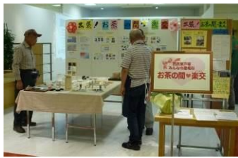
家具転倒防止対策講座と展示

以前から「お茶の間」の活動をご存じの店長から「2階の空いている一画を、次のテナントが決まるまで、“お茶の間♥楽交”で利用しませんか？」とお声がかかったのです。「お客様の中に、引っ越してきたばかりで知り合いがいなくて、どこに行けばつながりが作れるか探しているという方が結構いらっしゃるんです。ここがそういう機会になればいいですね。」とのこと。設立時から“降ってわいた話”には慣れっこの私たちも、さすがにびっくりです。