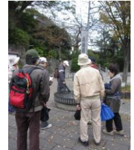
11月 プレイバント ～東戸塚散策ツアー～

4月から運営委員が中心となって、企画し準備を進めてきました。出展者がより良い形で活動を紹介しやすいように、出展者の立場に立って、会場のレイアウトやプログラムを考えてきました。