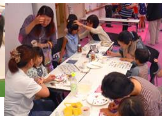
フェイスペイント