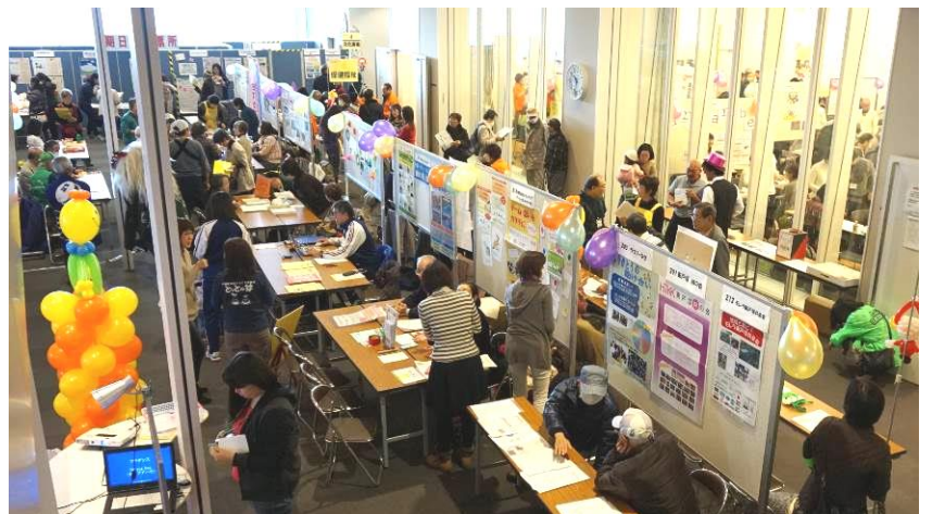
昨年のとつかお結び広場の様子

主催：とつかお結び広場運営委員会、とつか区民活動センター 後援：社会福祉法人 横浜市戸塚区社会福祉協議会