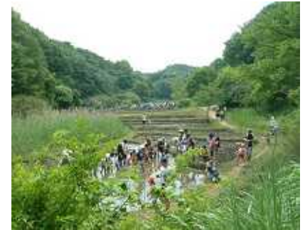
子ども達が田植え

さらに子供たちは、農作業を通して、環境を守ることの大切さや、自然のめぐみである食材をきちんといただくことのすばらしさを学んでいます。私たちの未来を担う子供達にはこれ以上ない体験でしょう。まさに「やとが創るひとの未来」が実感できた一日でした。