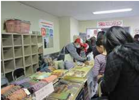
福祉施設の販売コーナー 体育館の入口には、木工製品、織物、パンやお菓子などが並びました。