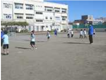
校庭 青空のもと、ドッジボールと竹とんぼで楽しみました。

12月4日（日）戸塚区を中心に様々な分野で活動している団体や個人が集まり、交流するイベント『とつかお結び広場』が戸塚小学校で行われました。今年は116活動団体・個人が集まり、パネル展示、体験コーナー、パフォーマンスなどで活動を紹介しました。お天気にも恵まれ、1800人以上の来場者があり大盛況でした。各コーナーでは出展者や来場された方々が交流されている場面が多く見られ、キャッチフレーズの“みんなで結ぼう！戸塚の輪 心の和”が広がった一日となりました。準備から開催に至るまで、多方面からたくさんのご協力をいただきました。皆様ありがとうございました。