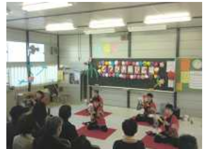
ウナシー劇場・健康コーナー 踊りやマジック、お話や歌、かるた、指圧など多彩なプログラムでした。