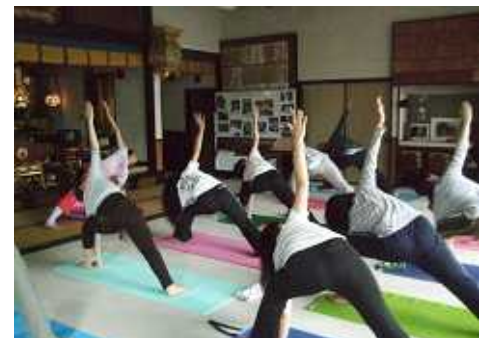
ほぼ毎週開催されるテラヨガ