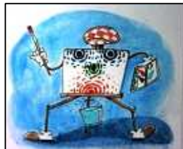
イメージキャラクターです

なぜ水彩画かという、それはみんなの心の中に持っているなつかしさがあるからです。子供の頃、校庭で並んで画いた“写生”を憶えているでしょう。絵は誰でも本能的に小さい時から画くものですが、大きくなる途中で画かなくなったり、機会が無くなったり、絵の道具はそのまま仕舞い込んだりします。ところが或る日突然、忘れていた絵心が浮かんで来て、なつかしさを憶え画きたくなるものです。ただ一人では無理で、下手な者同志や、みんなでワイワイいい合いながら、しかも歳を経ていますから、批評されたり比べられたりするのは嫌で、好き勝手に画きたいのです。そんな希望を持った人達が集まって楽しんでます。