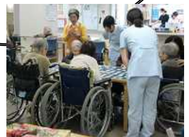
ふだはどこかしら？