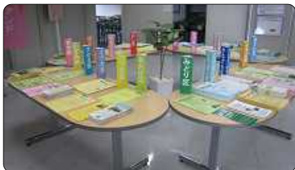
横浜市 18 区の区民活動センターのコーナーが会場内に設置されました。

とつか区民活動センターは会場のひとつ横浜市市民活動支援センターにパネル展示し、センターを紹介しました。